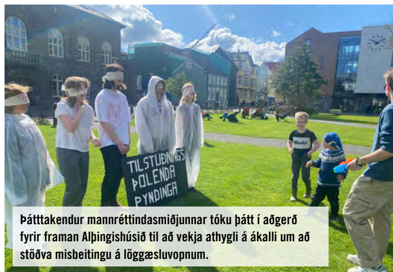
Þátttakendur mannréttindasmiðjunnar tóku þátt í aðgerð fyrir framan Alþingishúsið til að vekja athygli á ákalli um að stöðva misbeitingu á löggæsluvopnum.