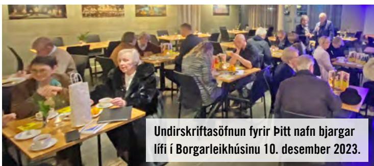
Undirskriftasöfnun fyrir Pitt nafn bjargar lífi í Borgarleikhúsinu 10. desember 2023.

Þá var staðið að 22 fræðslum í herferðinni í framhaldsskólum fyrir 1.139 nemendur, sem skilaði alls tæplega 8.000 undirskriftum frá framhaldsskólanemum.