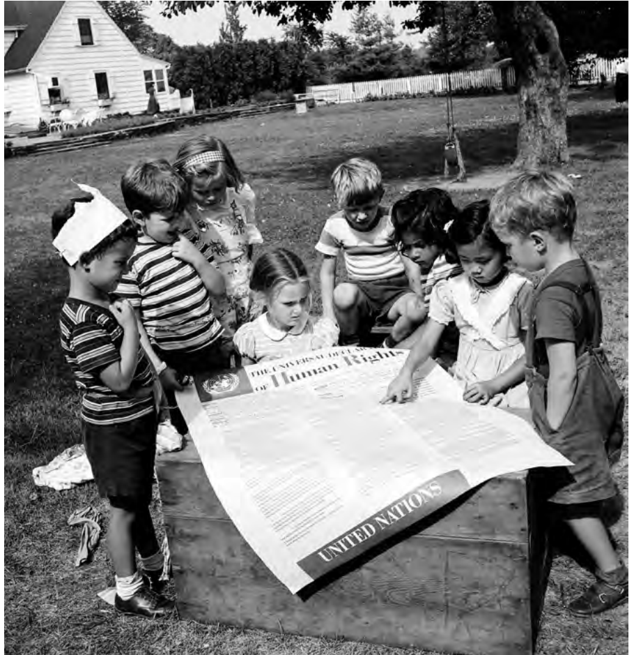
Mannréttindayfirlýsingin er undirstaða helstu alþjóðlegra mannréttindasamninga.

Mannréttindayfirlýsingin er undirstaða helstu alþjóðlegra mannréttinda-