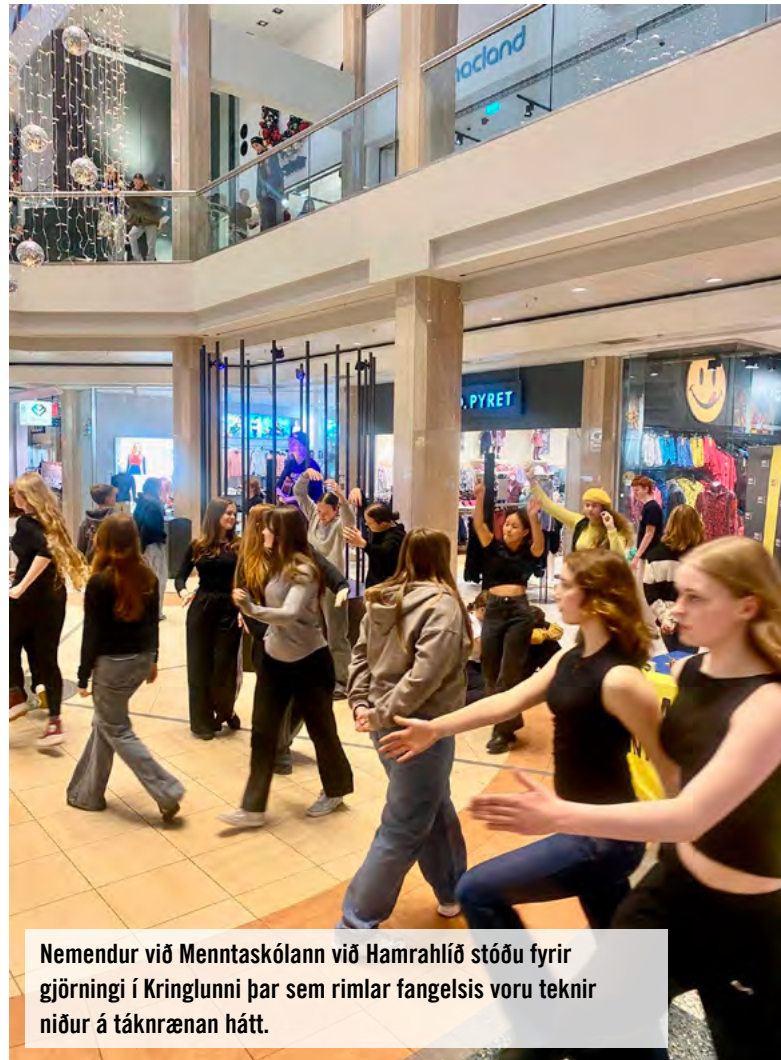
Nemendur við Menntaskólann við Hamrahlíð stóðu fyrir gjörningi í Kringlunni þar sem rimlar fangelsis voru teknir niður á táknrænan hátt.