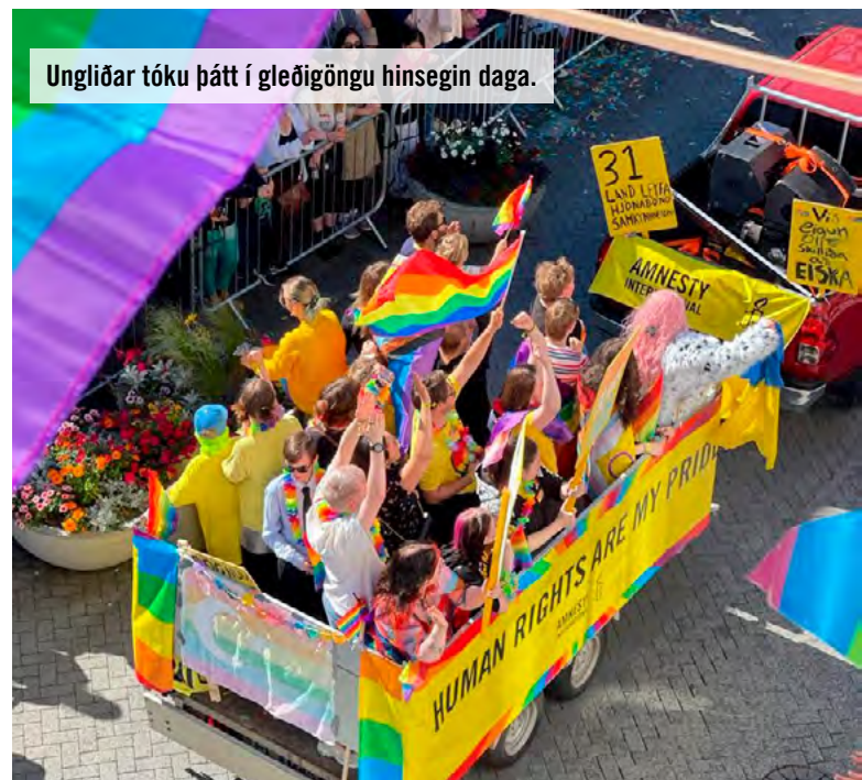
Ungliðar tóku þátt í gleðigöngu hinsegin daga.

Fræðsluárið 2023 heppnaðist vel og stóð helst upp úr góð ferð á Vestfirði í september þar sem haldnar voru 12 fræðslur í sjö bæjum fyrir 221 einstakling. Þá hélt Íslandsdeildin fjóra fræðslufundi um mannréttindi á skrifstofu samtakanna undir yfirskriftinni Hádegishlé þar sem sérfræðingar fjölluðu um ýmis mannréttindapæmu.