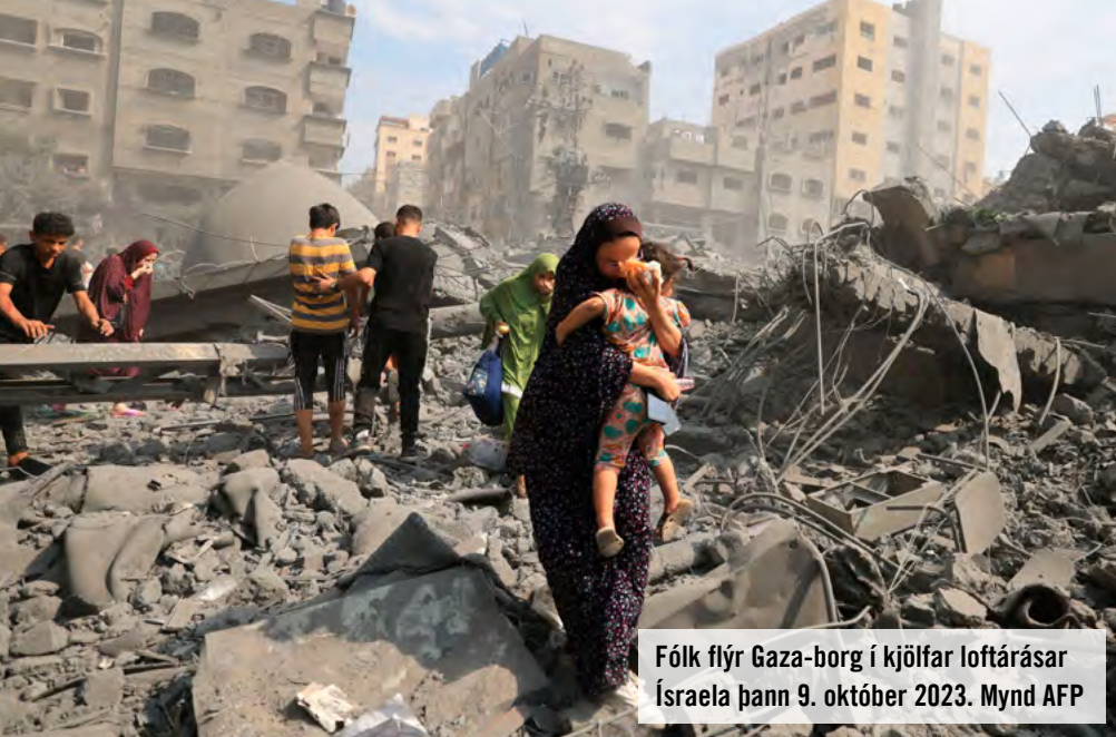
Fólk flýr Gaza-borg í kjölfar loftárásar Ísraels þann 9. október 2023.

beinist eingöngu að hernaðarlegum skotmörkum en í mörgum tilfellum fann Amnesty International engar sannanir fyrir því að meðlimir vopnaðra hópa eða hernaðarleg skotmörk væru í nágrenni við sprengingarnar sem um ræðir í þessum tilteknu árásum.