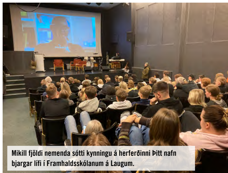
Mikill fjöldi nemenda sótti kynningu á herferðinni Pitt nafn bjargar lífi í Framhaldsskólanum á Laugum.