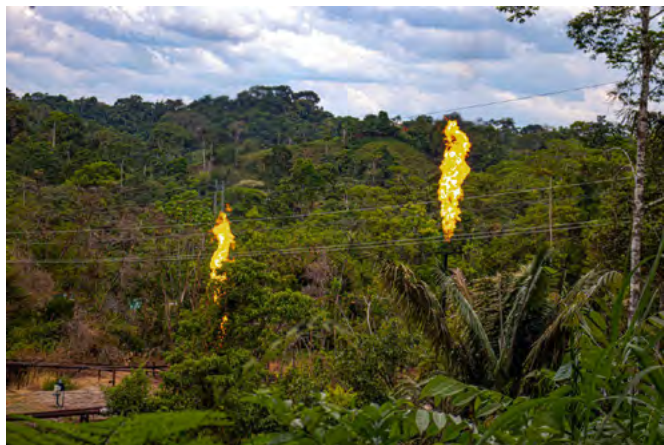
Gasbrunnar loga enn í Amazon-skógi í Ekvador.

Íslandsdeildin heldur þrýstingnum áfram þar til stjórnvöld standa við mannréttindaskuldbindingar sínar að fullu.