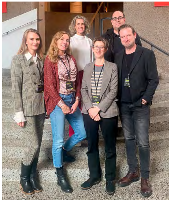
Starfsfólk Íslandsdeildar Amnesty International ásamt erlendum gestafyrirlesurum á málþingi í Þjóðminjasafninu.